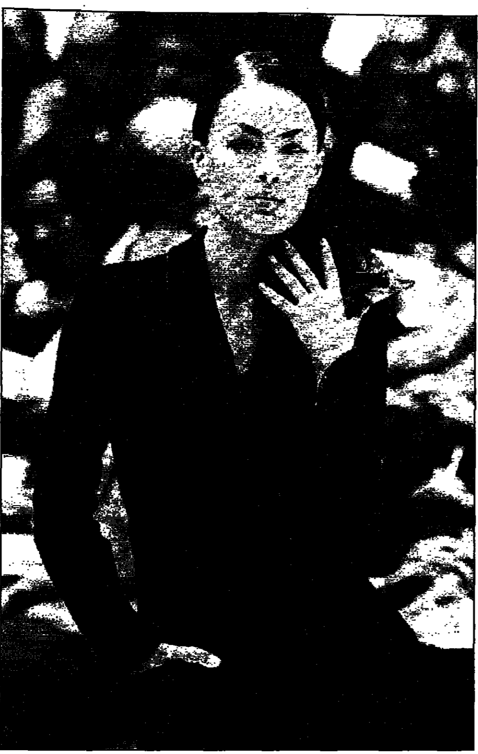
تصميم ميكر لجاكيت من الخمل وزهرة على الكتف، قبعته بيضاء لزياء ليماونيل أوتجاروا في باريس (اس (رويترز)

اسيوط - رويترز: تكثرت مصادر أمنية أن مسلحين فتحوا النار على حفل زفاف في جنوب مصر مما أدى إلى مقتل العريس وأصابة العروس ووالدها.